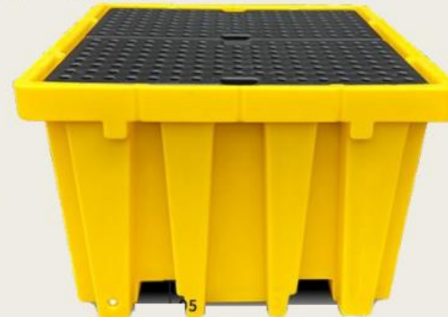
Tankvana za IBC kontejner Zapremina 1050 lt