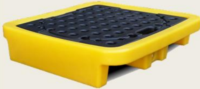
Tankvana za 1 bure Zapremina 43 lt